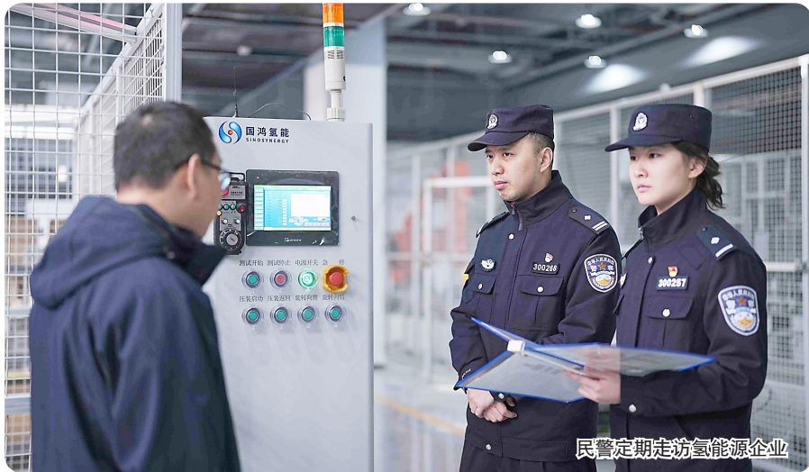
民警定期走访氢能企业

王拿着刚办好的证件点赞。针对企业员工集中办理居住证、身份证的需求,陶家派出所开辟涉企户政服务“绿色通道”,推出“预约办理、上门采集、延时服务”等便民利企举措。据了解,西部氢谷的落地既创造就业,也引进人才,除了激活大量本地就业人员,更有大批沿海地区迁入的技术人才,通过更便捷的政务服务,让他们来到重庆能够安心、方便地工作、生活。