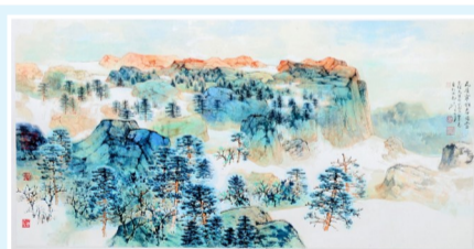
“三苏与巴蜀”书画文献展巡展(重庆站)参展绘画作品

展览地点:重庆市政协书画院展览厅 展览时间:2025年11月25日—2025年12月4日