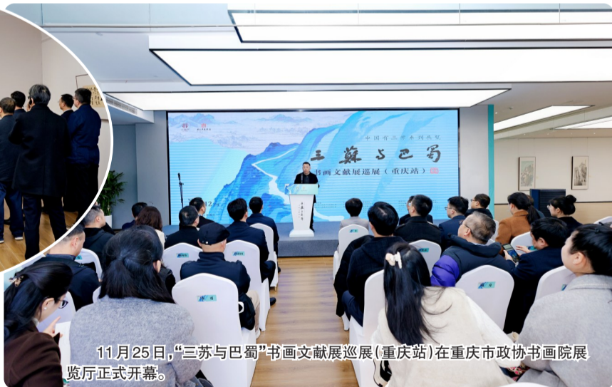
11月25日,“三苏与巴蜀”书画文献展巡展(重庆站)在重庆市政协书画院展览厅正式开幕。