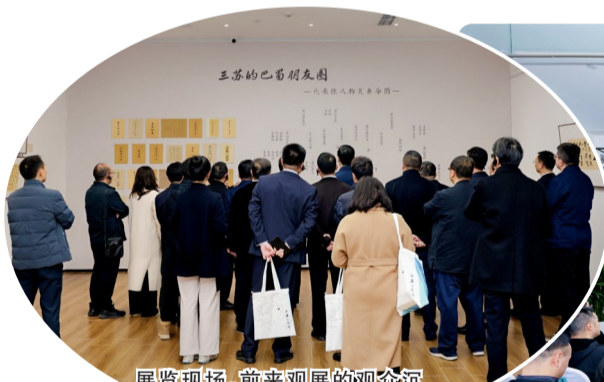
展览现场,前来观展的观众沉浸在千年文脉与艺术魅力之中。