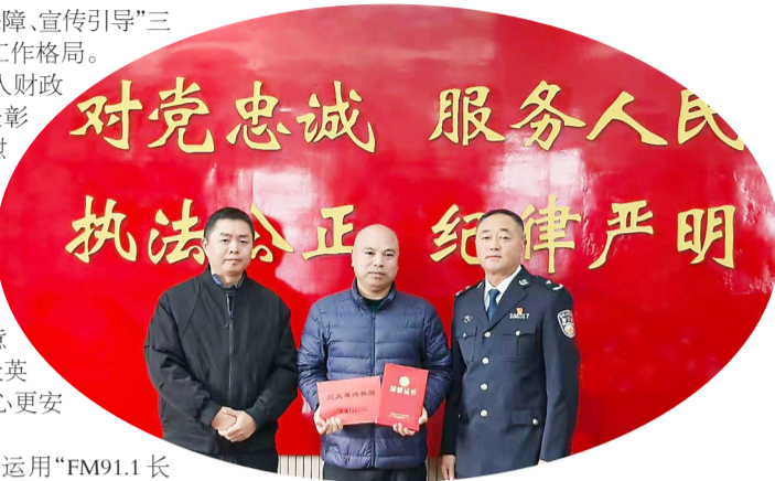
荣登全国见义勇为勇士榜,为平安长寿建设注入强劲正能量。

同时,该区率先运用“FM91.1长寿之声”及新媒体平台讲好英雄故事,破解“扶不扶”“救不救”的思想顾虑。2025年以来,长寿区已认定见义勇为人员4名,成功推荐1人