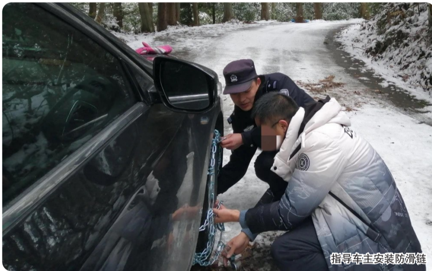
指导车主安装防滑链